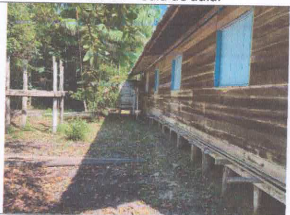
Foto 06 – Parede de vedação da escola e estrutura do reservatório desgastada.